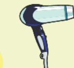
金属以外が多く 含まれるもの